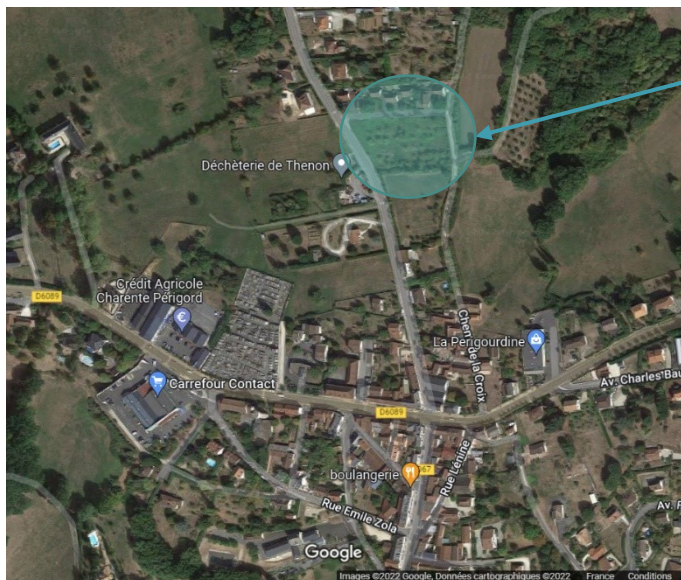
Emplacement du Lotissement La Farge

Périgord HABITAT Office Public de l'Habitat // DORDOGNE